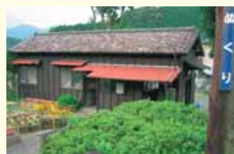
抜里駅 Nukuri Station