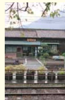
家山駅 Ieyama Station