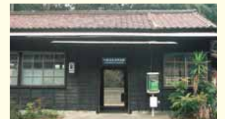
川根温泉笹間渡駅 Kawane-onsen-sasamado Station