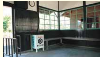
A wooden trash bin in the waiting room