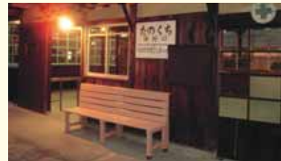
Lamps glow in the wooden station building at dusk.