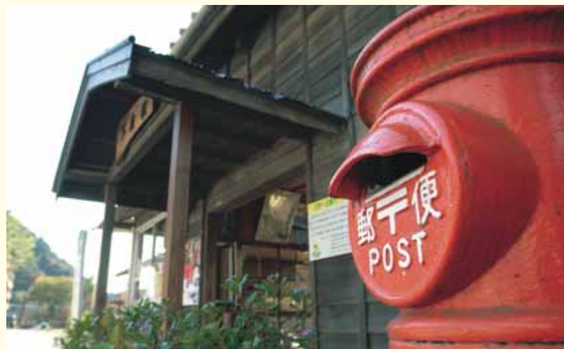
下泉駅 Shimoizumi Station