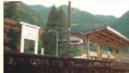
A platform shed and wooden bench