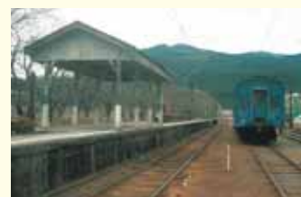
家山駅ホーム Ieyama Station