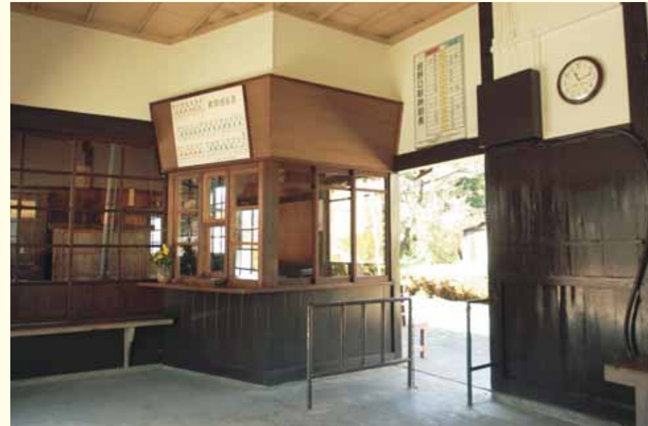
乗車券販売窓口 The ticket sales window