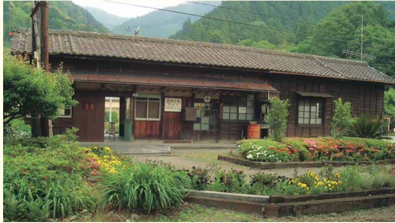
駅舎全景 Overview of the station building

この駅で君は何を見つけるだろうか… Can you imagine what will you find at this station?