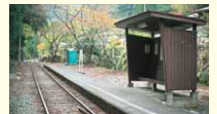
土本駅 Domoto Station