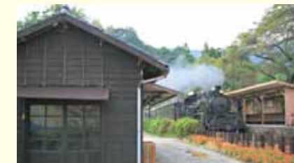
青部駅 Aobe Station