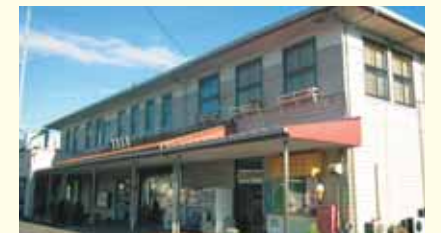
新金谷駅 Shinkanaya Station