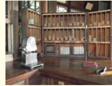
日付機と乗車券箱 A date stamper and ticket box