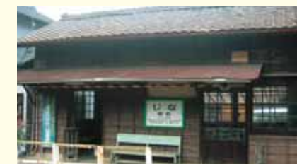
地名駅 Jina Station