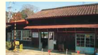
駿河徳山駅 Suruga-tokuyama Station