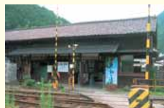
下泉駅 Shimoizumi Station