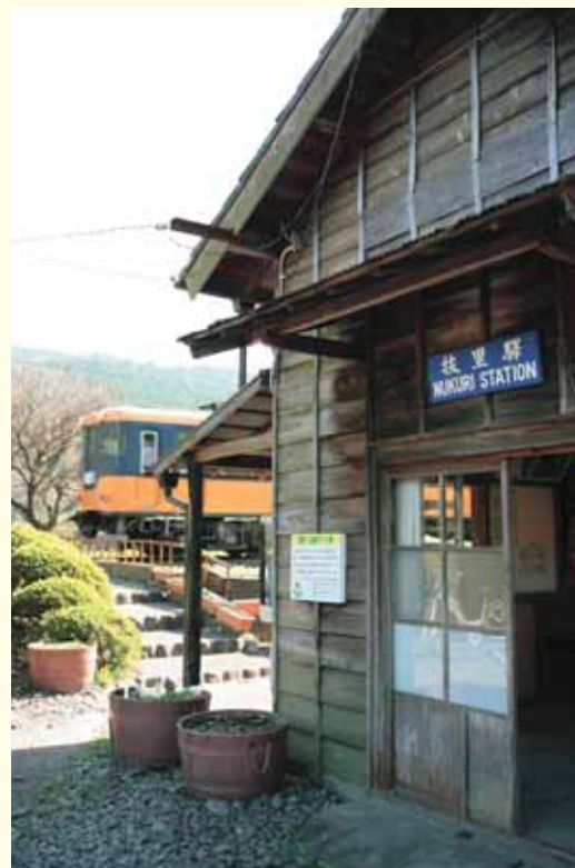
抜里駅 Nukuri Station

そこにあるのは記憶の片隅にしまい忘れていた風景 Here is scenery once stored in a corner of the memory and now forgotten.