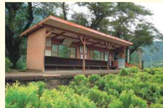
青部駅ホーム Aobe Station